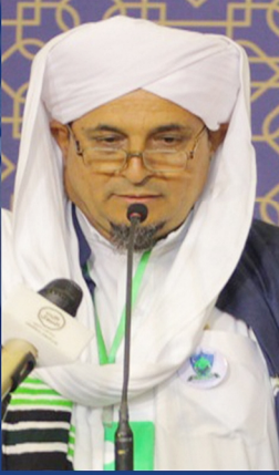
أ.عبدالرقيب العطاس رئيس مجلس أمناء الجامعة