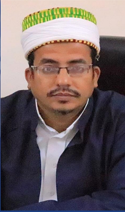
د.عبدالقادر العيدروس رئيس الجامعة